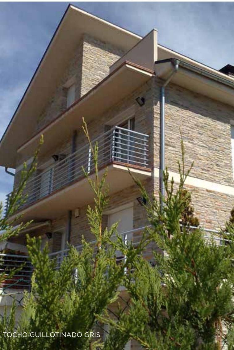
TOCHO GUILLOTINADO GRIS